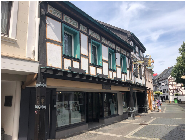
Temporäres Depot des Stadtmuseums Bad Neuenahr-Ahrweiler in der Niederhutstraße in Ahrweiler (2024)