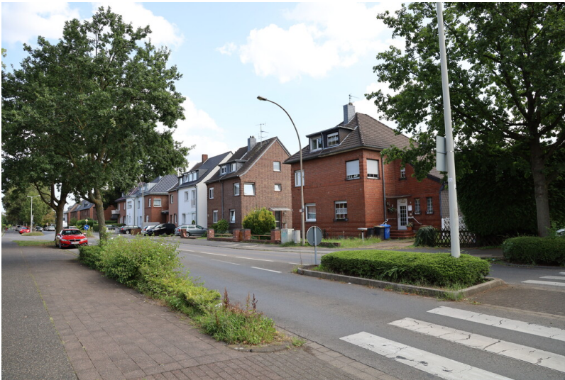
Einfamilienhäuser an der Uesdorfer Straße (2024)