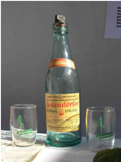
Flasche und Gläser des Bodendorfer Sprudel