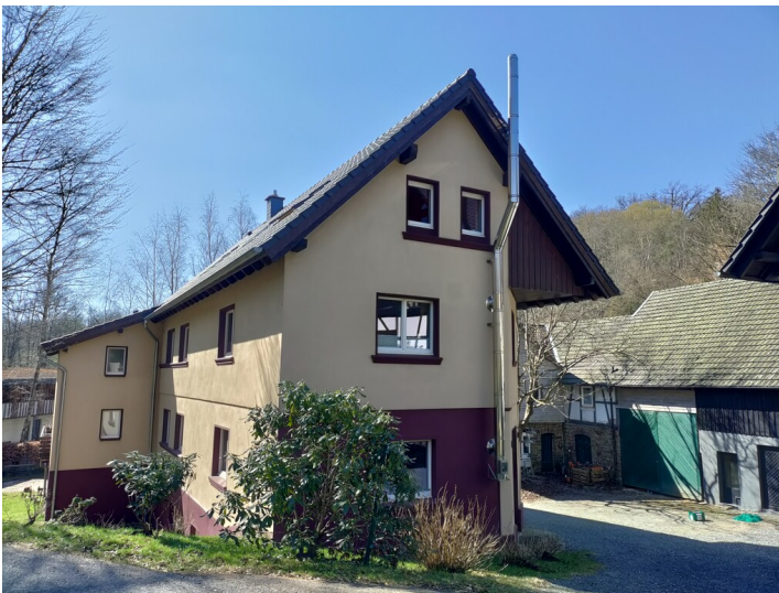
Bockemsmühle am Wahnbach in Much mit dazugehöriger Hofanlage (2025).