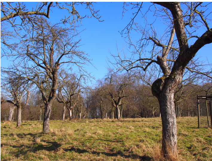
Quarzitgrube am Schnitzenbusch (2017)