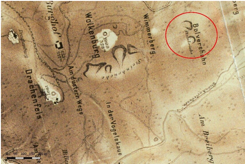
Steinbrüche am Bolversshahn.