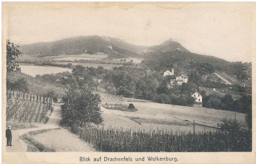
Postkarte Villa am Lessing (um 1900)