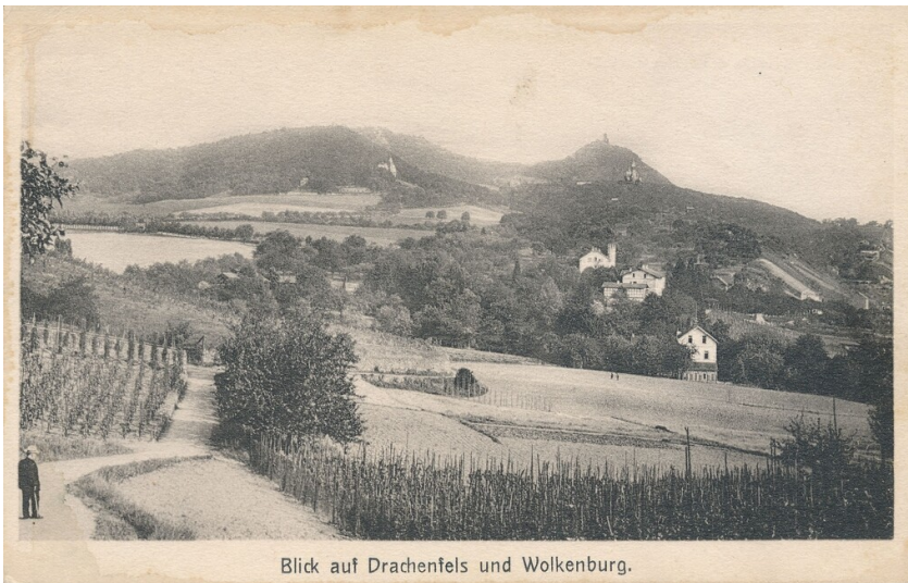
Postkarte Villa am Lessing (um 1900)