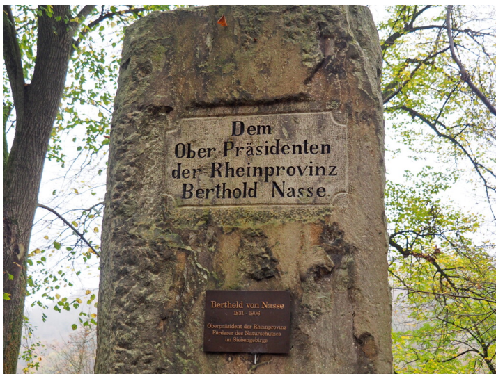
Inschrift am Denkmal auf dem Nasseplatz (2024)