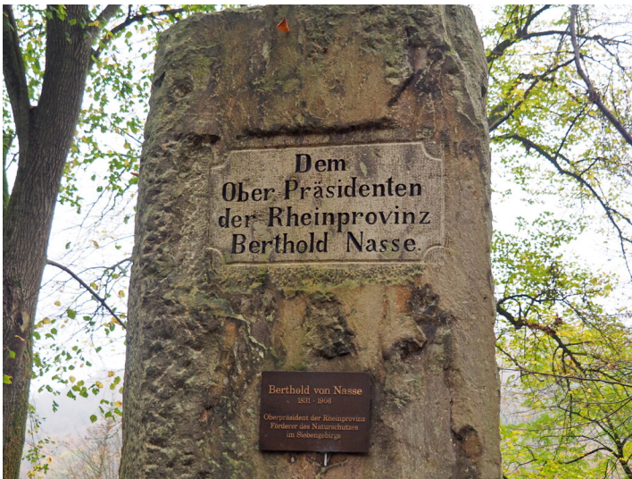
Inschrift am Denkmal auf dem Nasseplatz (2024)