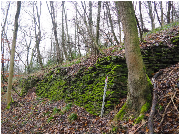
Weinbergsmauern Fraunter (2022)