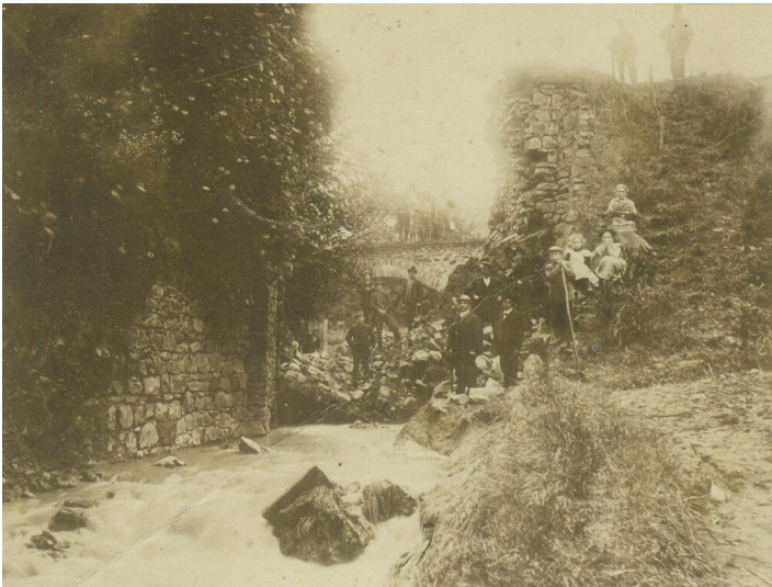
Bremsbahn West (1903)