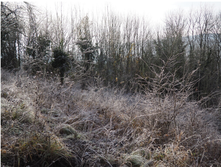
Weinberg Zopperich (2021)