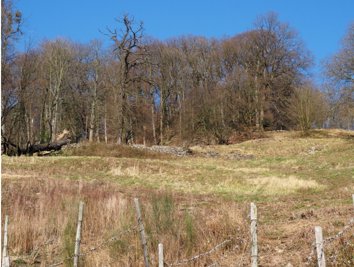
Weingut Haus Rüdenet (2023)