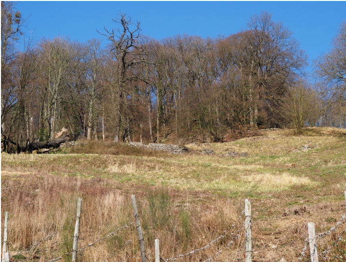
Weingut Haus Rüdenet (2023)