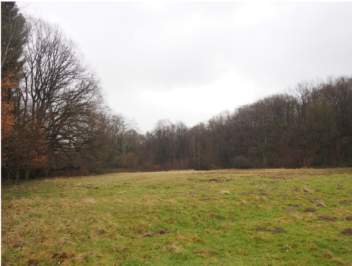
Ehemaliger Sportplatz Spielwiese (2017)