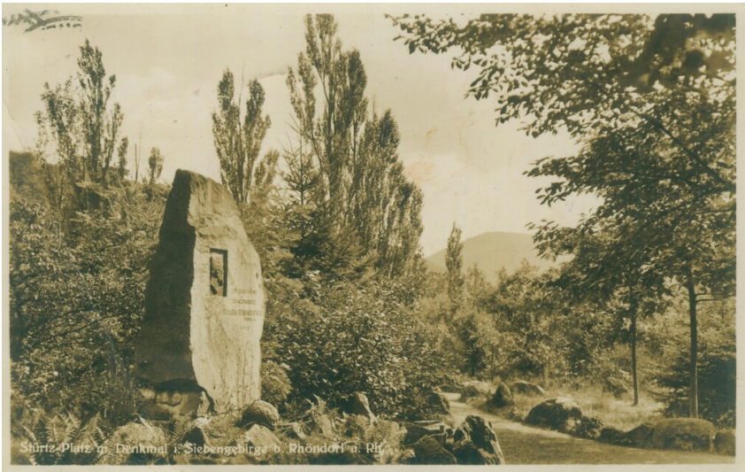
Stürztplatz (um 1950)