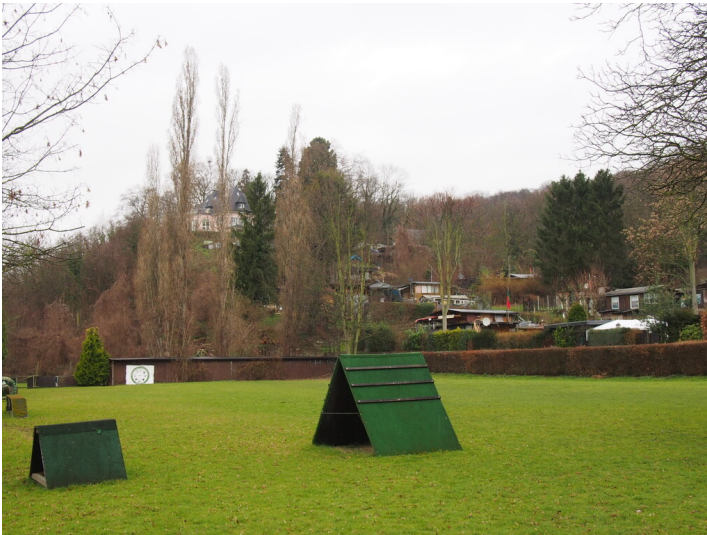
Ehemaliger Sportplatz am Kessel (2017)