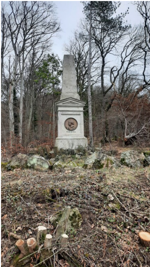
Denkmal für Heinrich von Dechen (2023)