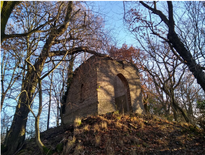
Hirschbergturm (2019)