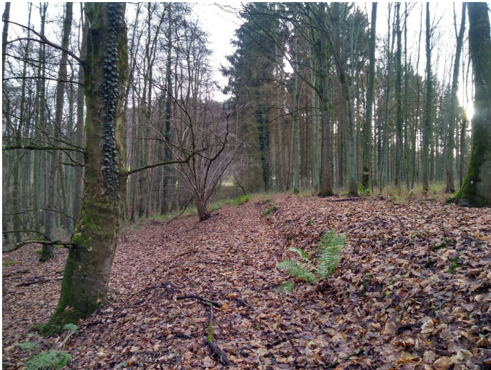
Pottscheid-Brücke (2019)