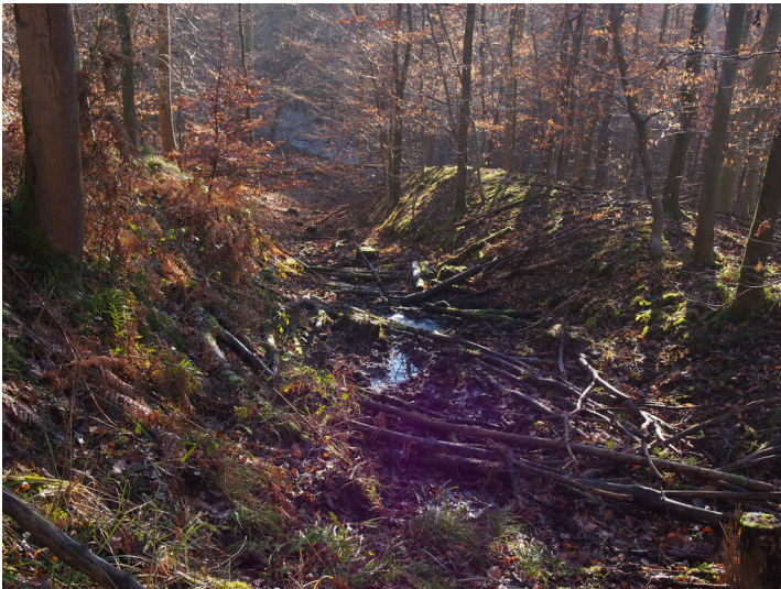
Hohlwege im Rhöndorfer Tal (2016)