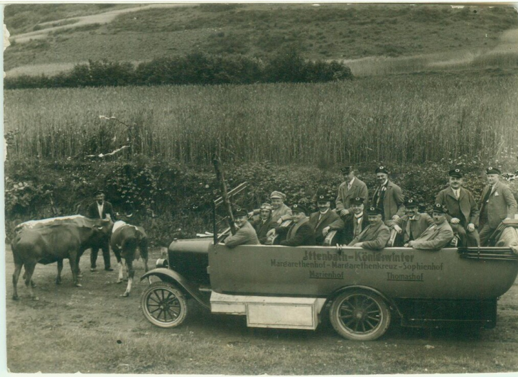
Neue Ittenbacher Landstrasse (1932)