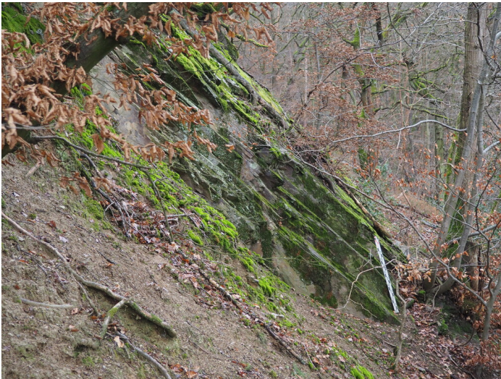
Grauwackesteinbrüche bei Rhöndorf (2022)