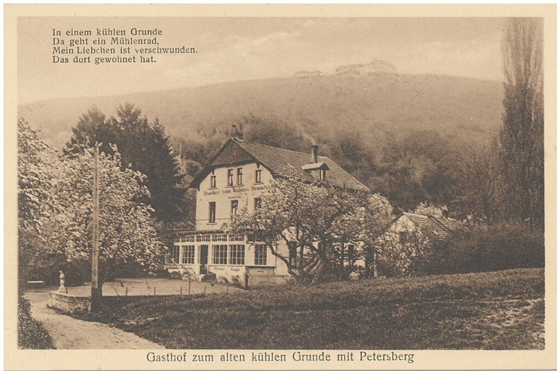
Sonntagsmühle - Zum wahren kühlen Grund (2022)