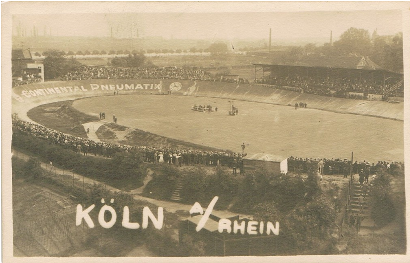
Historische Postkarte (um 1930): "Köln a/ Rhein" mit Blick auf die auch für Motorrad-Rennen genutzte Riehler Radrennbahn.