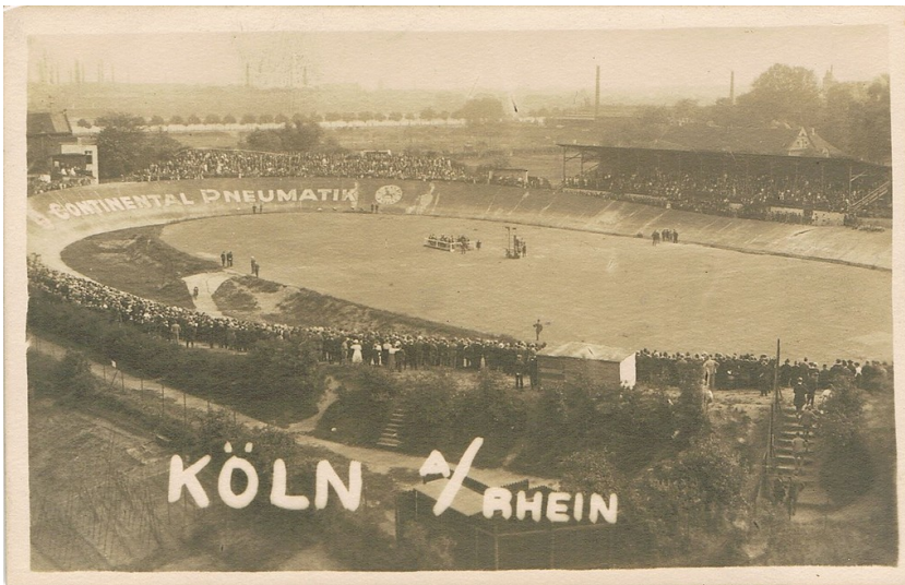
Historische Postkarte (um 1930): "Köln a/ Rhein" mit Blick auf die auch für Motorrad-Rennen genutzte Riehler Radrennbahn.