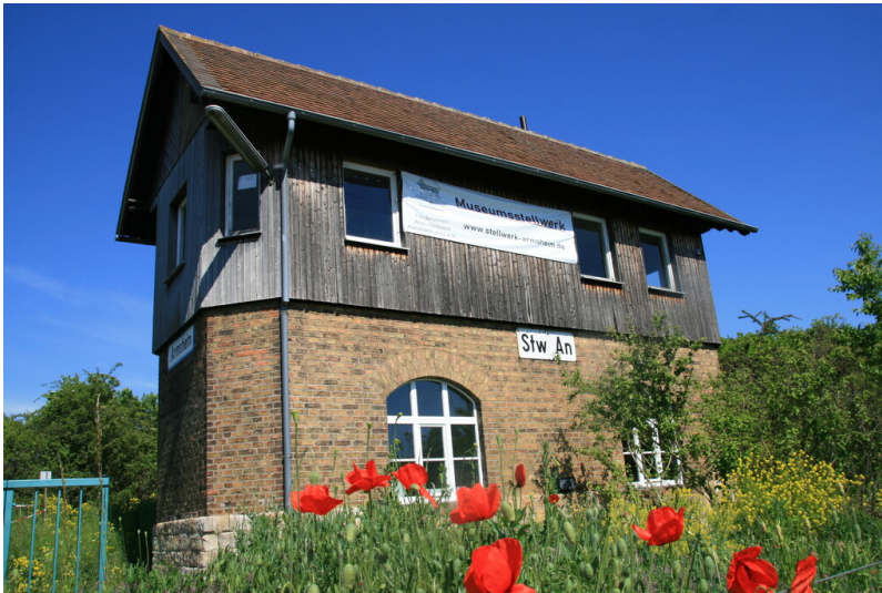
Museumsstellwerk Armsheim Nord (2025)