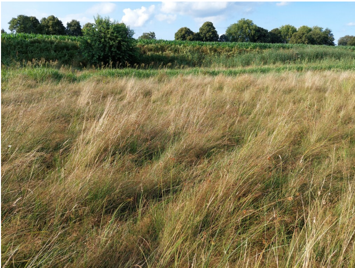
Blick nach Norden in eine Fläche verschiedener Gräser in der Feuchtwiese bei Schermbeck-Bricht (2024).