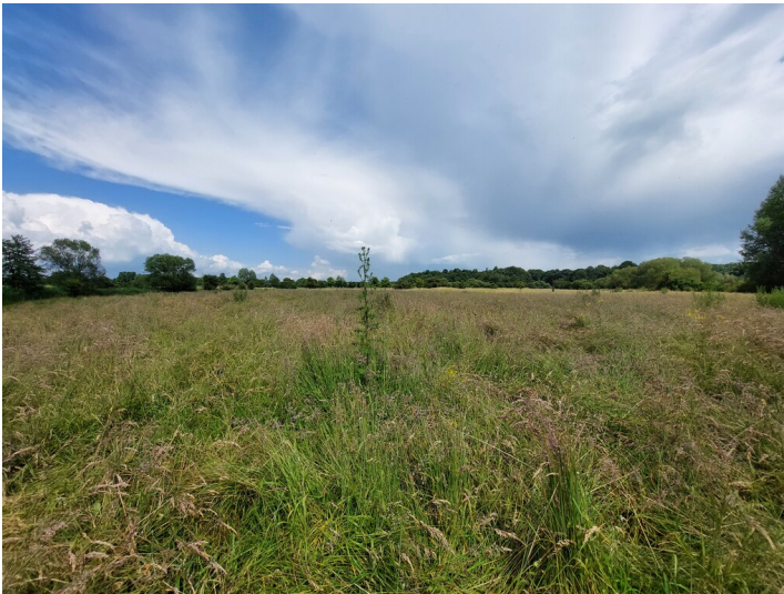
Gesamtansicht einer Flachlandmähwiese Auf dem Spick in der Lippeaue im Juni (2024).