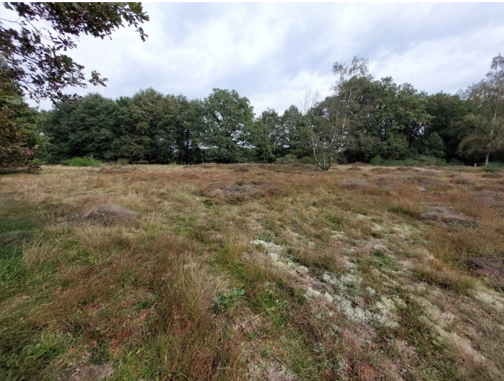
Ansicht auf einen Bereich vom Sandmagerrasen nördlich der Barnumer Weide (2023).