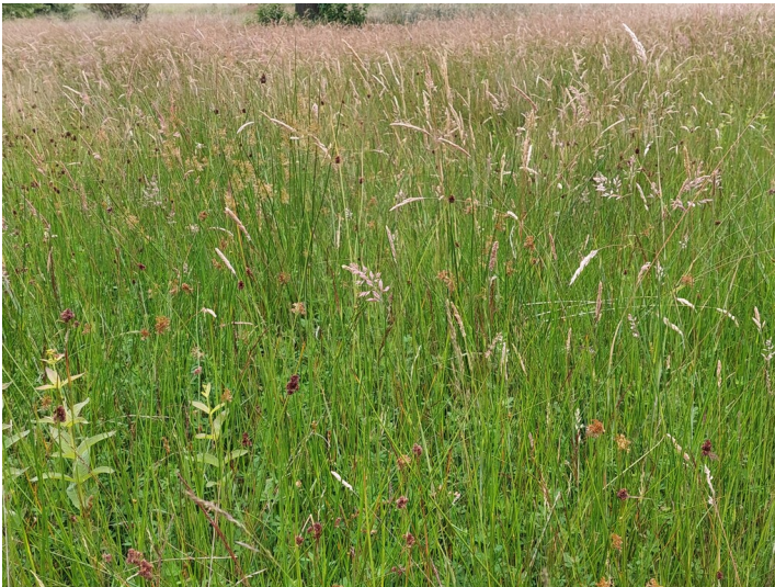
Ein Bereich der Feuchtwiese bei Bucholtswelmen im Bucholter Bruch (2024).