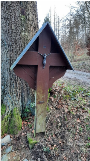
Wegkreuz im Wald (2024)