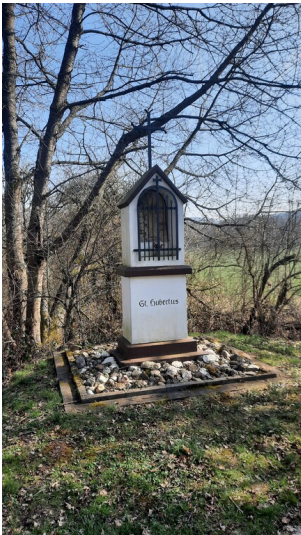
Bildstock St. Hubertus in Blens (2025)