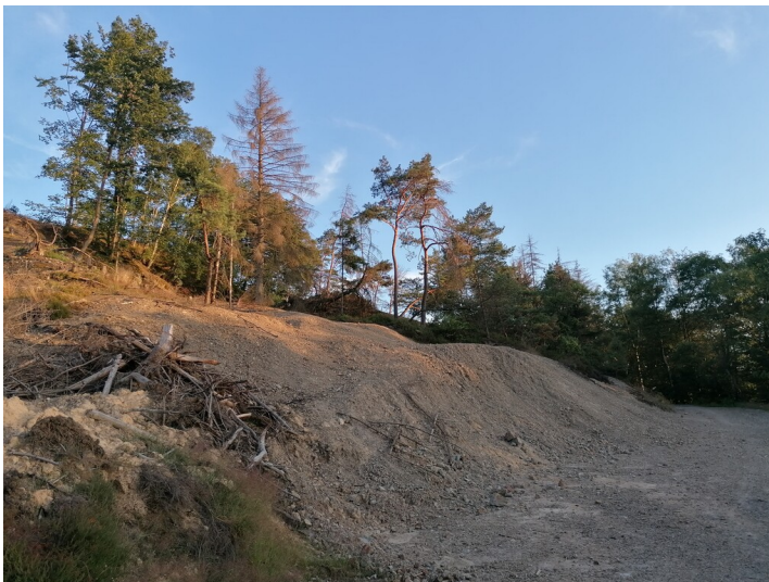
Die "Blaue Halde" am Heidenkeller bei Hoffnungsthal (2023).