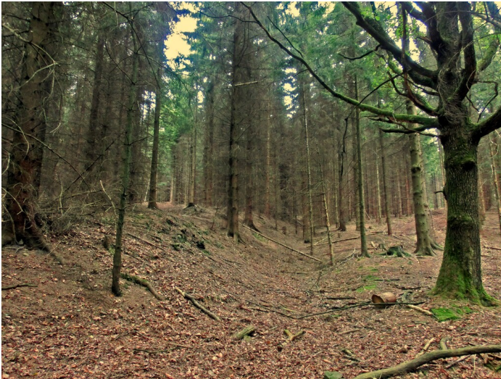
Der „Burgkopf“ auf dem Lüderich mit noch erkennbarer Wallanlage (2012).