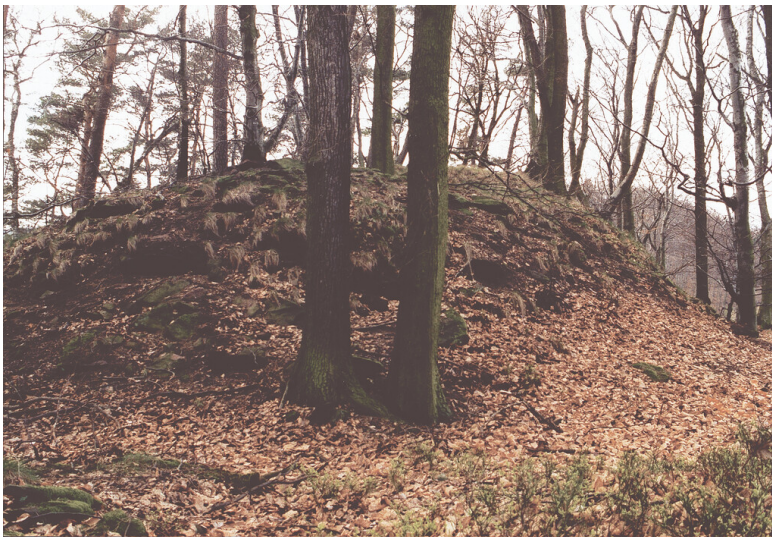
Wallanlage auf dem Querenberg (1993)