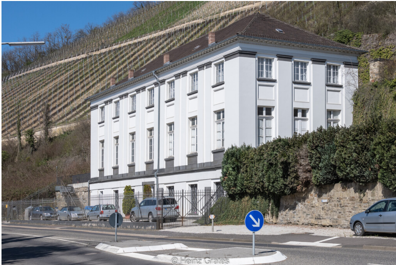
Neues Brunnenhaus in Heppingen (2021)