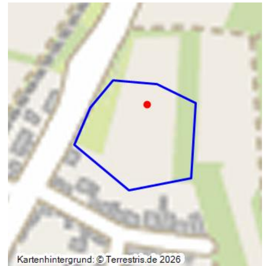
Webseite der Reihe "Lost Places in Römerberg" zum Hofgut Aubacher Hof bei Römerberg-Berghausen (2025)

Unterhalb des Berghäuser Ortsausgangs in Richtung Speyer befindet sich eine Gewanne mit dem Namen „Im Aubacher Hof“. Dieses Ackerland gehörte offensichtlich zu einem landwirtschaftlichen Hofgut des Speyerer Domkapitels. Nur wenige Details sind über den Hof bekannt. Die letzte Zustandsbeschreibung stammt aus dem Jahr 1740. Das Hofgut Aubacher Hof ist vermutlich bereits zum ausgehenden 18. Jahrhundert abgerissen worden. Aus diesem Grund zeigt die Objektgeometrie auch nur die vermutete Lage des Hofes an. Zu diesem Objekt gibt es eine multimediale Storytelling-Seite .