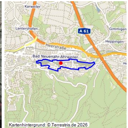
Virtueller 360-Grad-Raum des Kurortes Neuenahr, heute Bad Neuenahr-Ahrweiler (2025)

Georg Kreuzberg war die entscheidende Persönlichkeit, der in erster Linie die Entstehung des Badebetriebs in den drei zur Gemeinde Wadenheim gehörenden Dörfern Wadenheim und Hemmessen links und Beul rechts der Ahr zu verdanken ist.