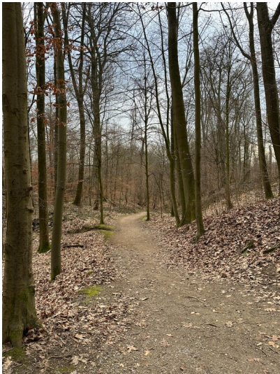
Ein Waldweg im Grafenberger Wald, Forstrevier Mitte im Düsseldorfer Stadtwald (2025).