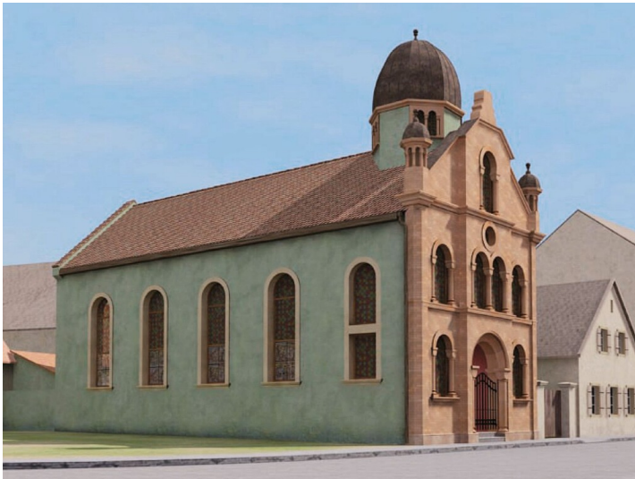
Rekonstruktion der Synagoge von Mutterstadt (2005)