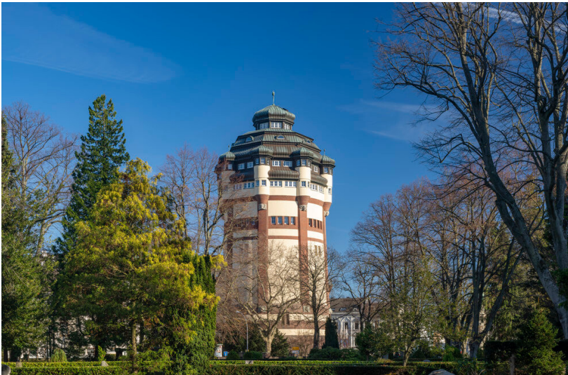
Neuer Wasserturm in Mönchengladbach (2025)