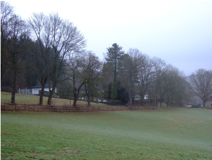
Ansicht des Nonnenbacher Wegs in Blankenheim (2025). Auf diesem Areal befand sich zwischen 1944 und 1955 eine Kriegsgräberstätte für Opfer des Zweiten Weltkriegs.