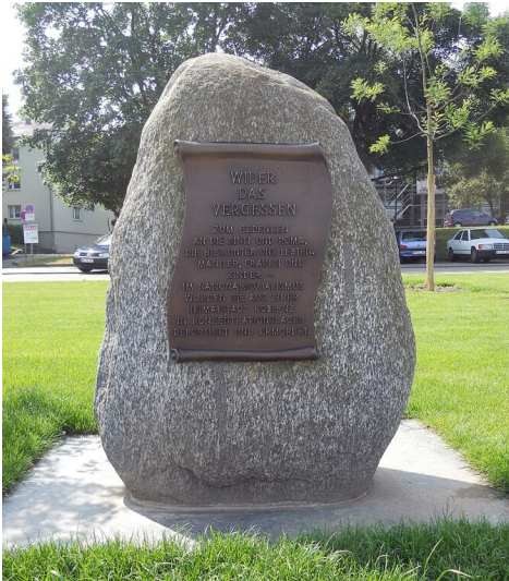
Gedenkstätte für die während der NS-Herrschaft verfolgten und ermordeten Sinti und Roma in Koblenz, der Gedenkstein am Peter-Altmeier-Ufer (2011).