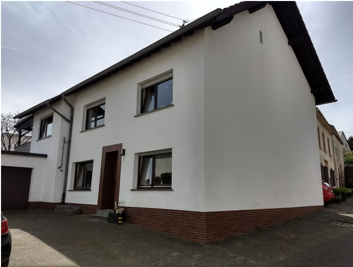
Das Stockhaus Bläsisch-Haus in der Kirchstraße 3 in Oberkail (2024)