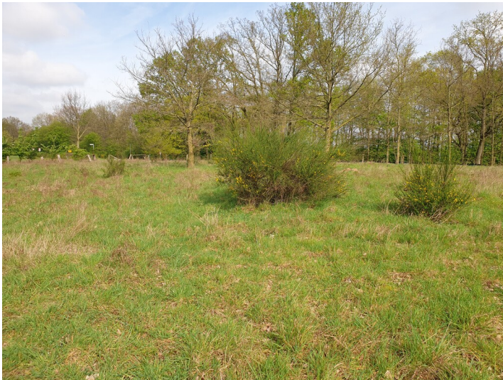
Übersicht Sandmagerrasen am Loisberg im Frühjahr (2024)