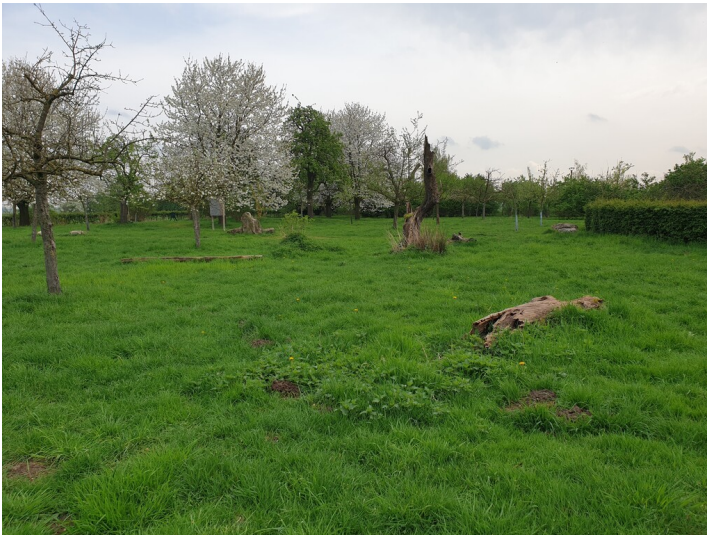
Fette Wiese mit blühenden Obstbäumen und liegendem Totholz im April beim Naturforum auf der Bislicher Insel (2024)