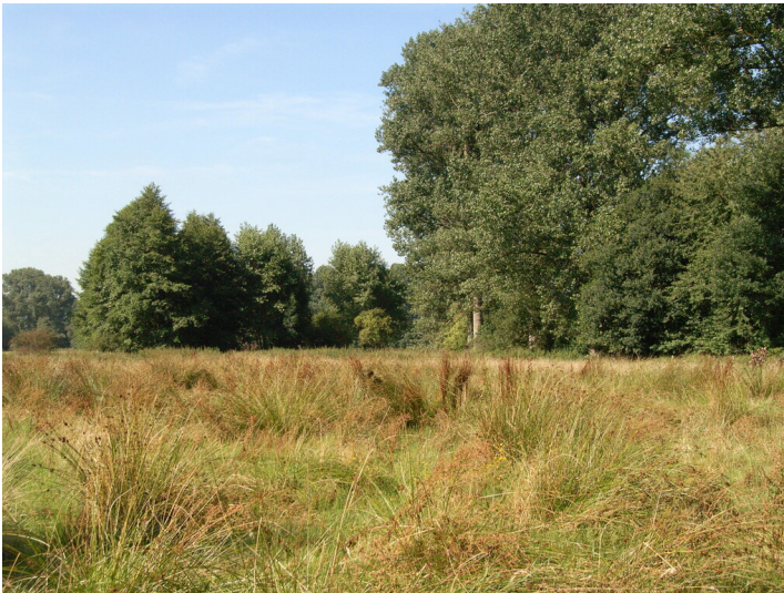
Feuchtwiesenfläche am Grenzdyck (2024)