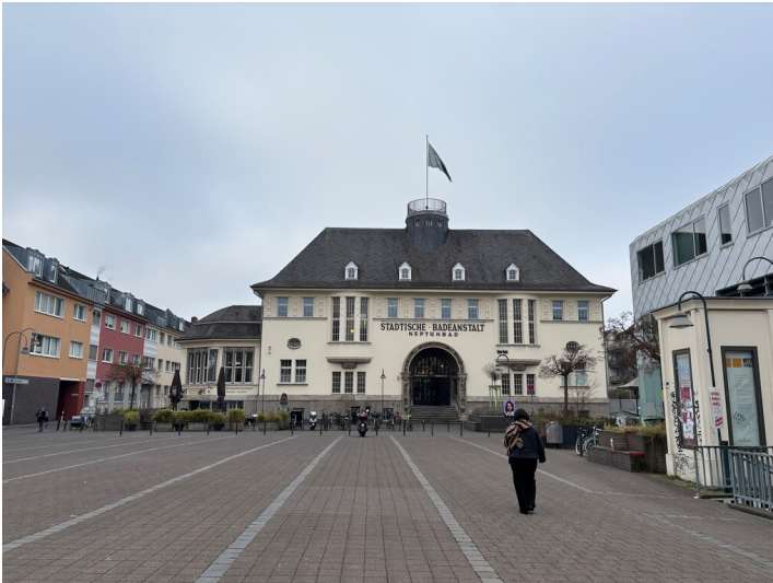
Frontalansicht des Neptunbads mit Jugendstilelementen (2025)