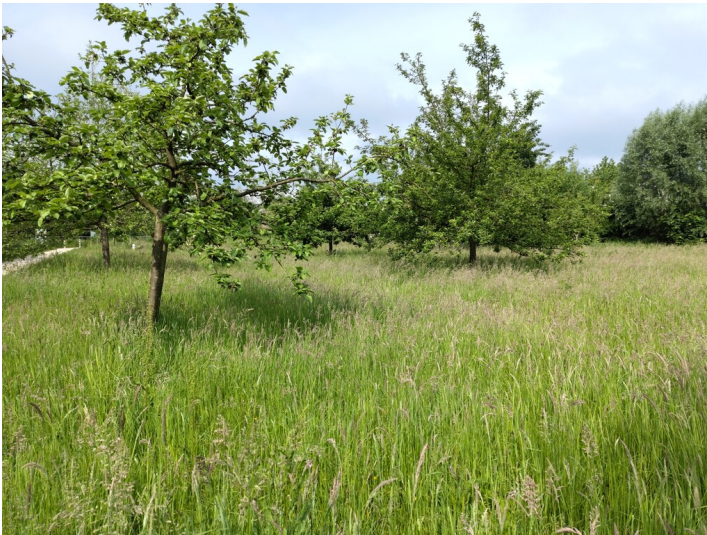
Obstwiese am Ratsbongert in Alpen (2024)